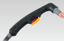
Torche MT-70 manuelle 70 A (50%) 6 m - 037502 12 m - 037519