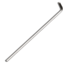
Art. 06500450 Asta in acciaio esagonale L.300 Hexagonal steel rod L.300