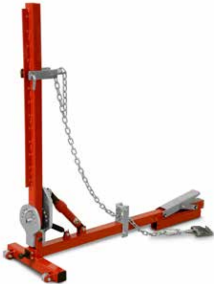
Art. 775 X MONSTER Braccio di tiro Pull arm