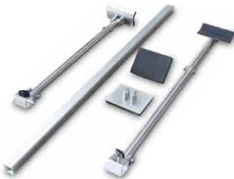
Art. 07700500 Kit bracci supporto laterali con piattelli in gomma Side supporting arms with pads