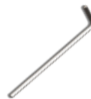
Art. 06500350 Asta in acciaio esagonale L.200 Hexagonal steel rod L.200