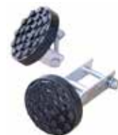
Art. 07700300 Kit contrasto tamponi Pair of rubber pads