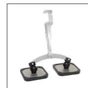
Pied double patin long Réf. 059368 Réf : 059375 (x2)