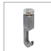
Crochet 2 dents Réf. 059382