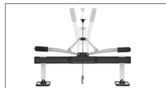
Barre de tirage premium Réf. 058996