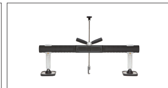
Barre de débosselage PREMIUM Réf. 059306