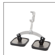
Pied double patin court Réf. 059344 Réf : 059351 (x2)