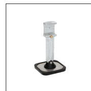
Pied simple court Réf. 059320