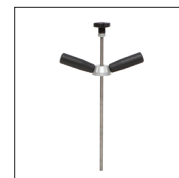
Tige pour barre de débosselage Réf. 059399