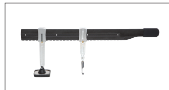
Levier de débosselage PREMIUM Réf. 059290