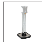
Pied simple long Réf. 059337