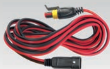
Rallonge 2.5 m - 029057